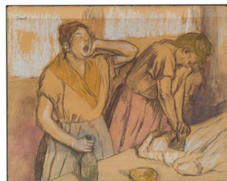
Edgar Degas Deux repasseuses Vers 1885 Pastel et fusain sur trois feuilles de papier brun assemblées, 60 x 76 cm Collection James T. Dyke