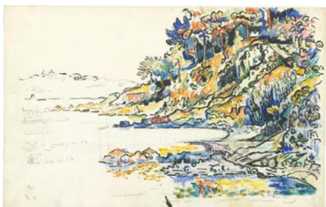
Paul Signac Calanque à Saint-Tropez 1906 Mine de plomb et aquarelle, 28 x 43,7 cm Collection James T. Dyke