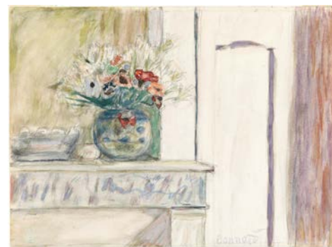
Pierre Bonnard Vase de fleurs sur un coin de cheminée Années 1920 Aquarelle et mine de plomb, 26,7 x 36,2 cm Collection James T. Dyke

Car, avec le dessin, nous touchons à la naissance de l'œuvre, à l'intimité du premier geste, à la diversité des tentatives et des expérimentations. C'est toute l'inventivité de l'artiste, ses intuitions, ses réussites fulgurantes ou ses tentatives éphémères, qui s'offrent sans fard aux yeux de l'amateur sensible ou simplement curieux.