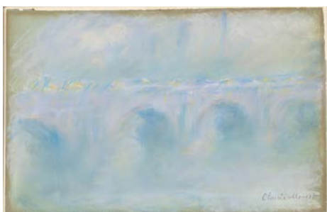
Claude Monet Le Pont de Waterloo 1901 Pastel, 31,1 x 50,2 cm Collection James T. Dyke