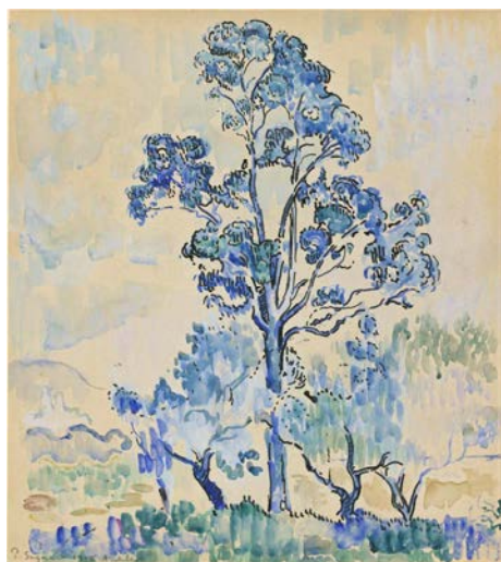
Paul Signac Eucalyptus à Antibes 1910

Encre noire, aquarelle et gouache, 39 x 34,5 cm